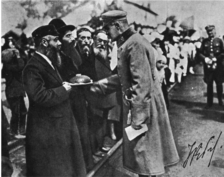
Józef Piłsudski witany chlebem i solą przez społeczność żydowską w Dęblinie po zdobyciu miasteczka podczas wojny polsko-sowieckiej w 1920 r. Ta słynna fotografia stała się symbolem pozytywnego wizerunku Piłsudskiego wśród Żydów. Dęblin, sierpień 1920 r.

Pierwsza relacja prasowa pojawiła się 1 września 1920 r., kiedy to polska gazeta opublikowała relację z pierwszej ręki reportera, który 29 sierpnia odwiedził obóz. W artykule „Zagadka Jabłonnej” reporter oszacował, że przebywało tam około trzech tysięcy Żydów. Wśród żydowskich żołnierzy „było wielu ochotników, intelektualistów i naukowców wyrwanych z różnych oddziałów wojska. Nikt nie wie, co się dzieje”. Ci internowani nie byli oskarżeni o żadne przestępstwo, ale, jak twierdził reporter, wydawało się, że mają status więźniów. Autor artykułu poparł swoje twierdzenie opowieścią, że po powrocie do Warszawy odwiedził czterech żydowskich żołnierzy z obozu w Jabłonnej, którzy potrzebowali leczenia niezwiązanego z internowaniem. „Są traktowani jak więźniowie” – relacjonował. Kiedy żydowscy osadzeni zostali zwolnieni z Jabłonnej 9 września, dwadzieścia cztery dni po internowaniu, podawano, że w obozie przebywało 17 680 żydowskich żołnierzy.