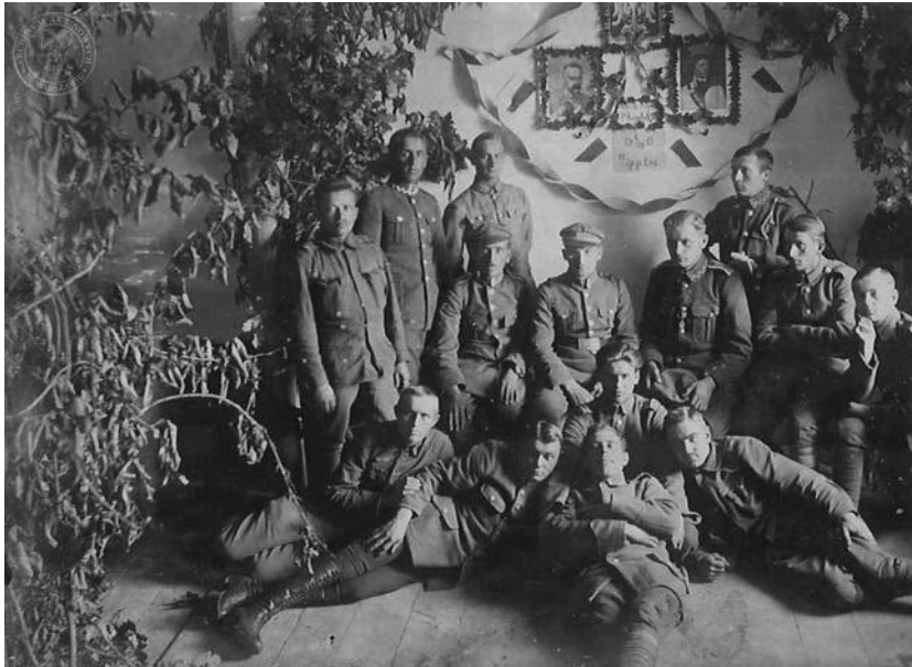
Polscy żołnierze pozują po zdobyciu Wilna, 6 lipca 1919 r. Za nimi wiszą portrety ich dowódcy, generała Piłsudskiego oraz generała Tadeusza Kościuszki, naczelnika polskich sił powstańczych w 1794 r.

Piłsudskiego przypominając mu, że siły Hallera nie mogą być wykorzystywane przeciwko Ukraińcom. Przesuwając się na tyle daleko, aby utworzyć granicę z Rumunią, wojska polskie zabezpieczyły Galicję Wschodnią po tym, jak Piłsudski przejął dowództwo nad nową ofensywą, przybywając tam 22 czerwca 1919 r. Gdy osiągnięto rzekę Zbrucz 17 lipca, wojna w Galicji Wschodniej dobiegła końca. Rada Najwyższa Głównych Mocarstw Sprzymierzonych i Stowarzyszonych poprosiła Piłsudskiego o wycofanie się do linii demarkacyjnej zatwierdzonej przez Ententę. Piłsudski odmówił grożąc podaniem się do dymisji, jeśli zostanie do tego zmuszony.