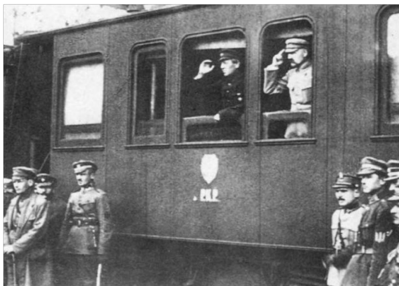
Piłsudski i jego ukraiński odpowiednik Symon Petlura podczas ofensywy wojskowej pod Kijowem. Winnica, Ukraina, 17 maja 1920 r.