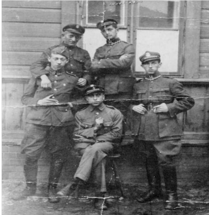
Żydowscy żołnierze w dniu uwolnienia z obozu internowania w Jabłonnej, dokąd podczas wojny polsko-sowieckiej wysyłano żydowskich żołnierzy wojska polskiego oskarżonych o sympatie pro-bolszewickie. Jabłonna, 8 września 1920 r.